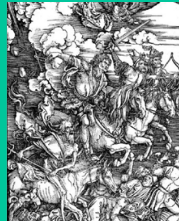
چهار سوار سرنوشت آلبرخت دورر از کتاب مکاشفات یوحنا، باسمه چوبی، ۱۴۹۸م

باور به ظهور مصلح جهانی در میان ادیان مشترک است. منبع اصلی اوانجلیست‌ها یا مسیحیان صهیونیست‌ها برای شناخت علائم آخرالزمان و آینده‌نگری، مکاشفات یوحناست. بر اساس مکاشفه یوحنا در عهد جدید، باب ششم و آیات ۱ الی ۸ «بره خداوند» یا همان عیسی (ع) چهار مهر و موم از هفت مهر و موم را گره‌گشایی می‌کند و چهار سوار آخرالزمان آزاد می‌شوند. این اسب سواران به ترتیب بر چهار اسب به رنگ‌های سفید، قرمز، سیاه و رنگ‌پریده سوارند که به نمادهای مریضی، جنگ، قحطی و مرگ تفسیر میشوند. این مکاشفه با سبک‌های متفاوت توسط هنرمندان به تصویر کشیده شده است. اهمیت این موضوع تا جایی است که در ابتدای رونق صنعت چاپ در قرن پانزدهم، چهار اسب سرنوشت توسط هنرمند آلمانی آلبرخت دورر روی باسمه چوبی حکاکی و چاپ شد