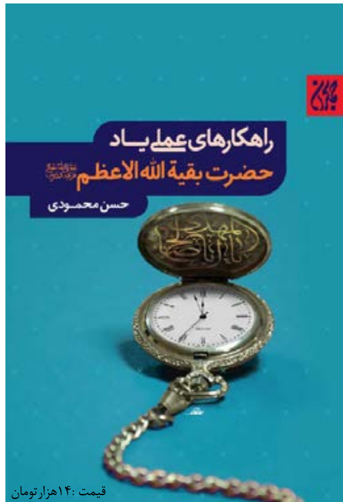
قیمت: ۱۴ هزار تومان

این حقیقت، ادامه دهنده راه اسلام و قرآن است و مسئله‌ای ریشه‌ای و اساسی می‌باشد که قرآن به آن بشارت داده است و پیامبر عظیم‌الشان (صلی‌الله‌علیه‌وآله) در جاهای بسیار و مناسبت‌های عدیده درباره آن صحبت کرده است و ائمه (علیهم‌السلام) نیز شیعیان خود و تمامی امم اسلامی را به وجود این امام بشارت داده‌اند