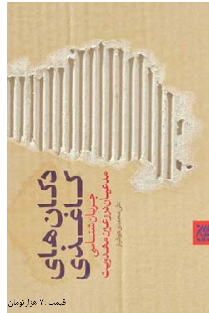
قیمت: ۷ هزار تومان